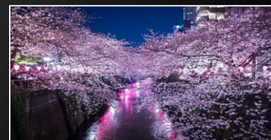
さんホーム目黒2021年8月新規開設！