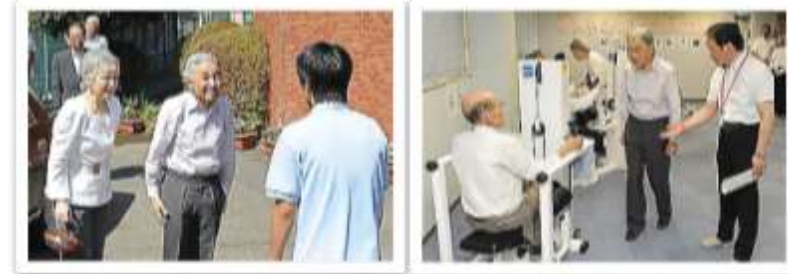
安倍元首相 (2015年11月8日)