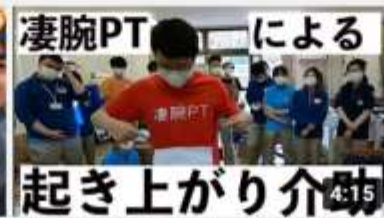
【凄腕PT】起き上がり介助のキホンを学ぼう！ 4:15