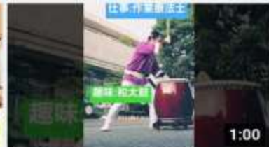
作業療法士の和太鼓がプロ並なので聴いてほしい 304 回視聴・1 週間前