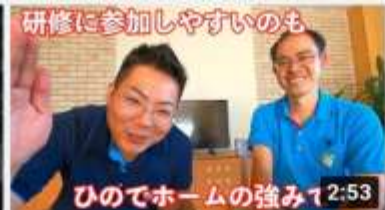
研修を受けてきました【健康ゲーム指導士】 155 回視聴・1 週間前