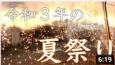
【夏祭り】現場から施設全体を巻き込む大型レクリエー... 157 回視聴・1 日前