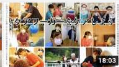
【現】の喜 366 回視聴・1 週間前