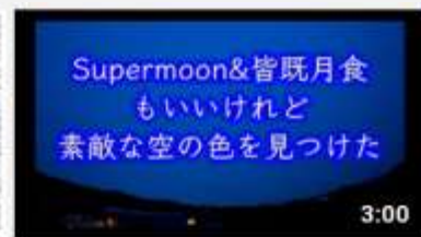
【現】の喜 366 回視聴・1 週間前