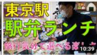
【サンライズ鉄心坊】「食」で元気を届けよう！旅行気... 10:39