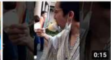
おかわりください | ひのでホームのオオタニサン SHO... 432 回視聴・1 週間前