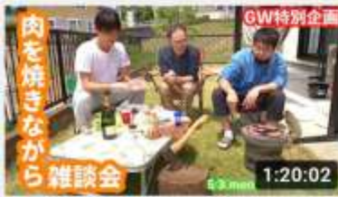
【GW特別企画】芝生の上から生配信！火おこしなが... 1:20:02