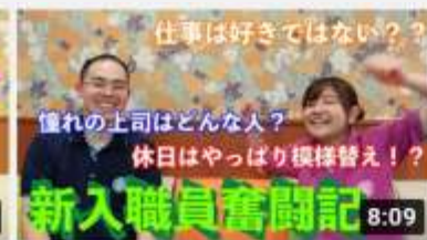
【現】の喜 366 回視聴・1 週間前