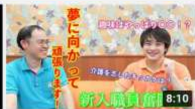
【現】の喜 366 回視聴・1 週間前