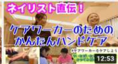
【手荒れが気になる方へ】ネイリストが教える！おやす... 195 回視聴・5 日前