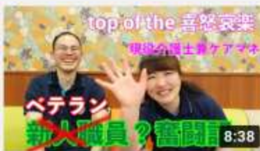
【現】の喜 366 回視聴・1 週間前