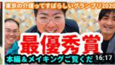
【最優秀賞受賞作品】ひのでホームのいいところBEST3! 16:17