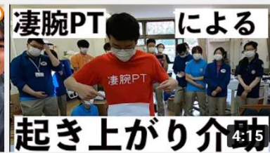
【凄腕PT】起き上がり介助のキホンを学ぼう！ 4:15