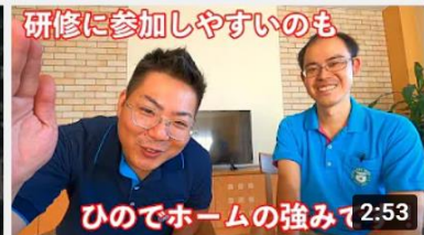
研修を受けてきました【健康ゲーム指導士】 155 回視聴・1 週間前