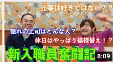
憧れの上司はどんな人？ 休日はやっぱり模様替え！？ 新入職員奮闘記 8:09