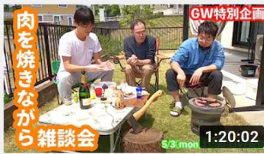
【GW特別企画】芝生の上から生配信！火おこしなが... 1:20:02