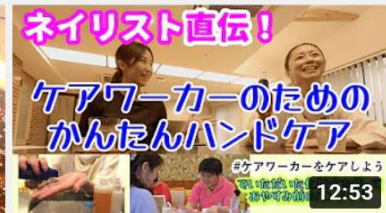
【手荒れが気になる方へ】ネイリストが教える！おやす... 195 回視聴・5 日前