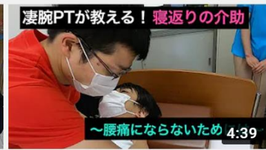
【腰痛予防】凄腕PT縄田が教える寝返りの介助 4:39