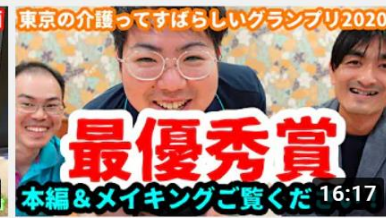
【最優秀賞受賞作品】ひのでホームのいいところBEST3! 16:17