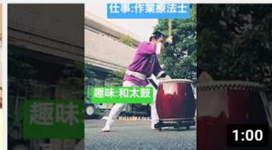
作業療法士の和太鼓がプロ並なので聴いてほしい 304 回視聴・1 週間前