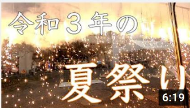
【夏祭り】現場から施設全体を巻き込む大型レクリエー... 157 回視聴・1 日前