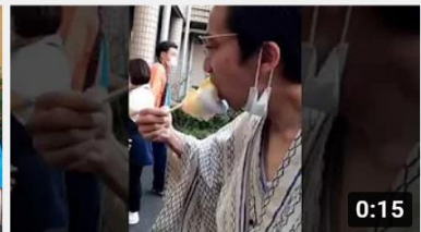
おかわりください | ひのでホームのオオタニサン SHO... 432 回視聴・1 週間前