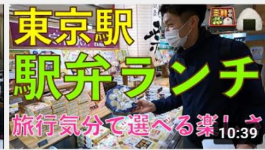
【サンライズ鉄心坊】「食」で元気を届けよう！旅行気... 10:39