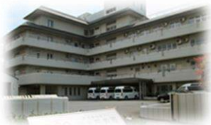
特別養護老人ホーム羽田 大田区本羽田3-23-45