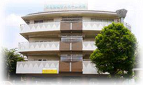
特別養護老人ホーム大森 大田区大森西1-16-18