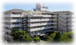
特別養護老人ホーム池上 大田区仲池上2-24-8