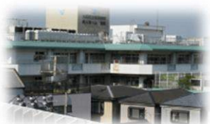
特別養護老人ホーム蒲田 大田区蒲田2-8-8