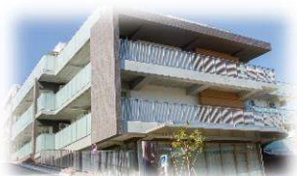
特別養護老人ホーム馬込 大田区西馬込2-11-2