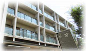
特別養護老人ホームたまがわ 大田区下丸子4-23-1