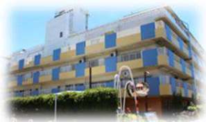
特別養護老人ホーム靴谷 大田区西靴谷2-12-1