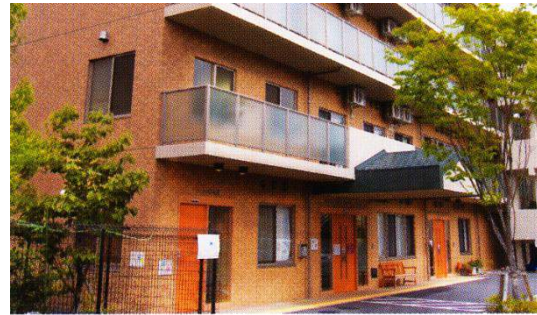
地域密着型 特別養護 老人ホーム