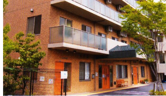
地域密着型 特別養護 老人ホーム